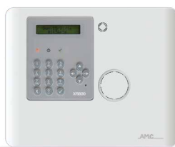
XR800 centrale via radio

Utilizzabile con tutti i dispositivi del sistema via radio Serie 800