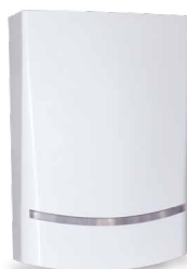
SRL800 sirena radio da esterno