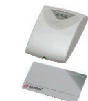
PROXI + PROXI-CARD Inseritore di prossimità da interno ed esterno (IP34). Tessera di prossimità Proximity key/card reader for indoor/outdoor use (IP34)