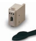
ECLIPSE + SAT Inseritore di prossimità da incasso (disponibile in diverse soluzioni per la maggior parte delle placche in commercio) Chiave di prossimità Proximity key reader Proximity key Available in several different designs